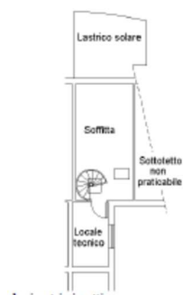
Piano sottotetto h med.=200

In base ai dati catastali, il primo piano mansardato presenta un'altezza media interna di 2,0 mt ed ospita un locale tecnico (1,85x3,35), una soffitta (3,04x6,0) e un lastrico solare (3,80x3,20), il tutto privi di rifiniture interne, come meglio descritto nel seguito.